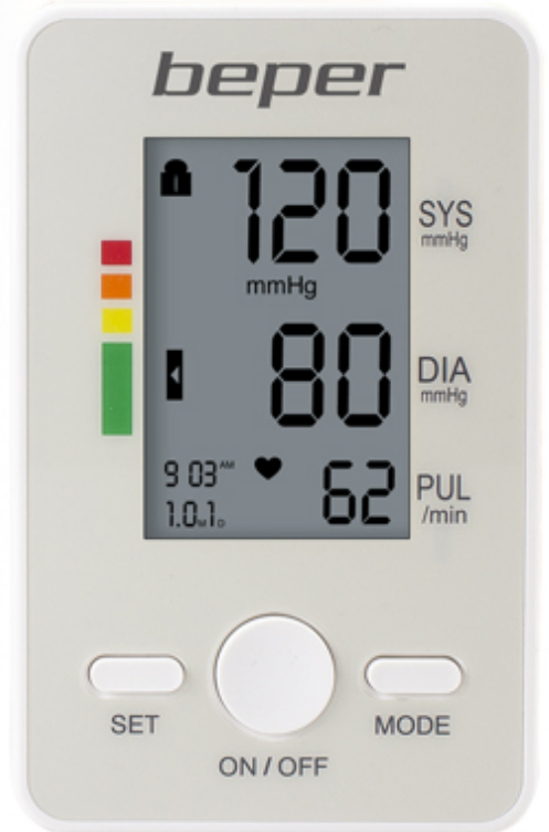
Misuratore di pressione da braccio