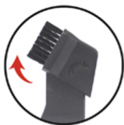
Ugello 2 in 1 per fessure 2-in-1 crevice nozzle