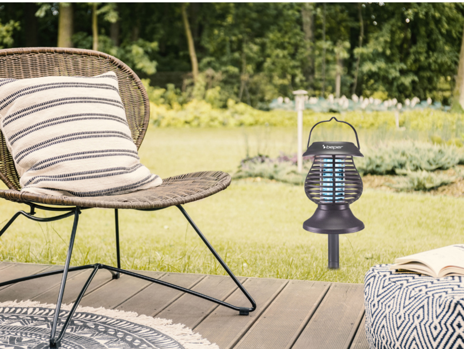
Moustiquaire à lanterne solaire