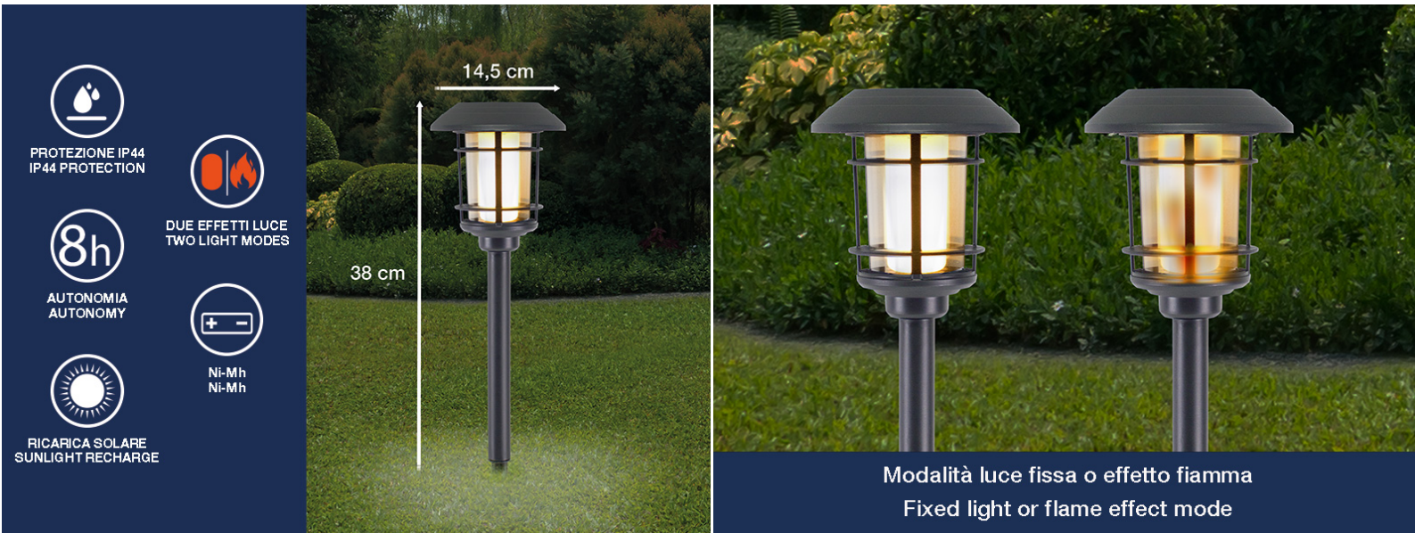
Lampada solare con effetto fiamma Fiaccola