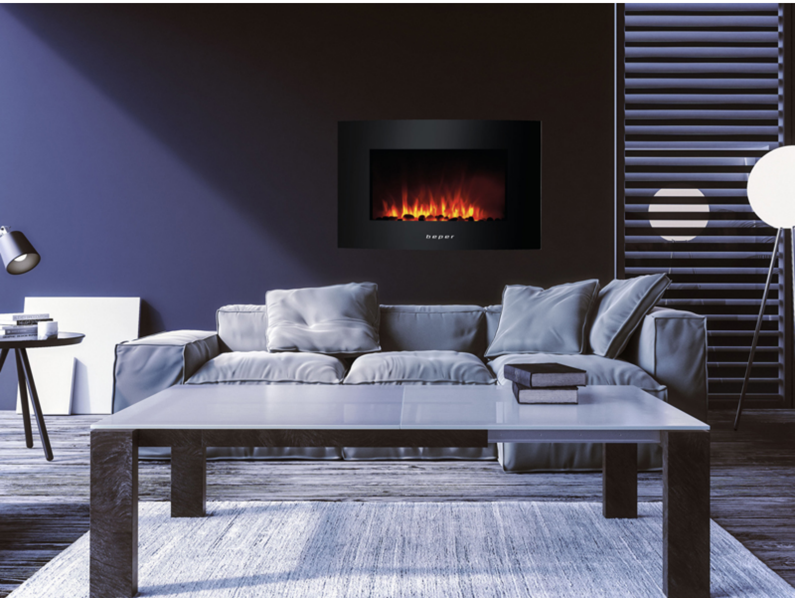
Caminetto elettrico con fiamma LED