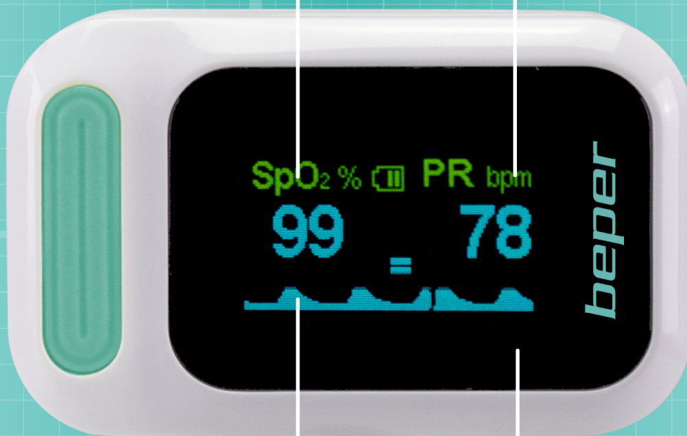
GRAFICO CURVA IMPULSO PULSE CURVE GRAPH